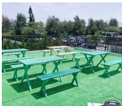
■2Fルーフトップスペース 席数：着席最大40席 4名テーブル×10 ※雨天時は店内にご案内