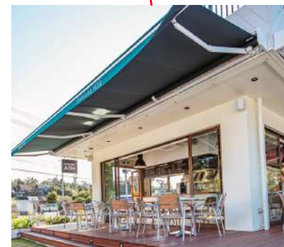
■1Fテラススペース 席数：24席 4名テーブル×6