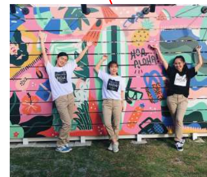
■インスタスポット 集合写真等に大人気！