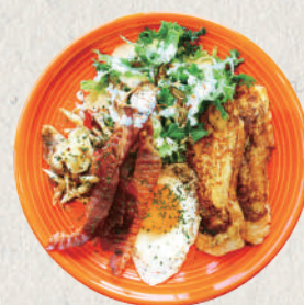
Local Mushroom & Bacon