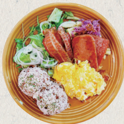
Meat + Scramble Eggs + Rice + Salad