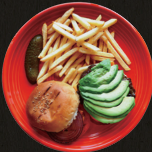
HIBACHI Grill Burger with Avocado