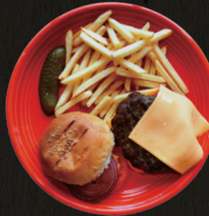
HIBACHI Grill Burger with Double Cheese