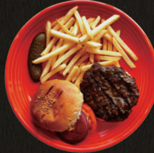
HIBACHI Grill Burger