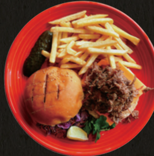
Hawaiian Pulled Pork Burger