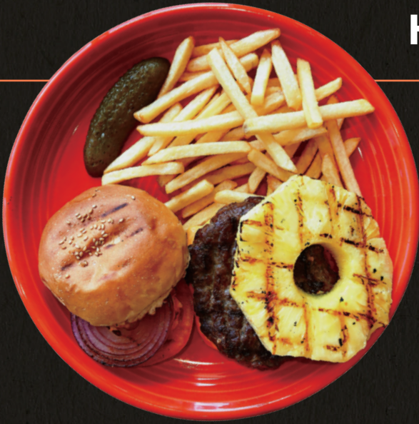
HIBACHI Grill Burger with Pineapple